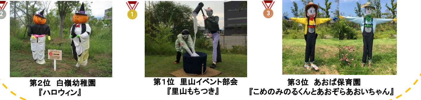
第2位 白嶺幼稚園 『ハロウィン』