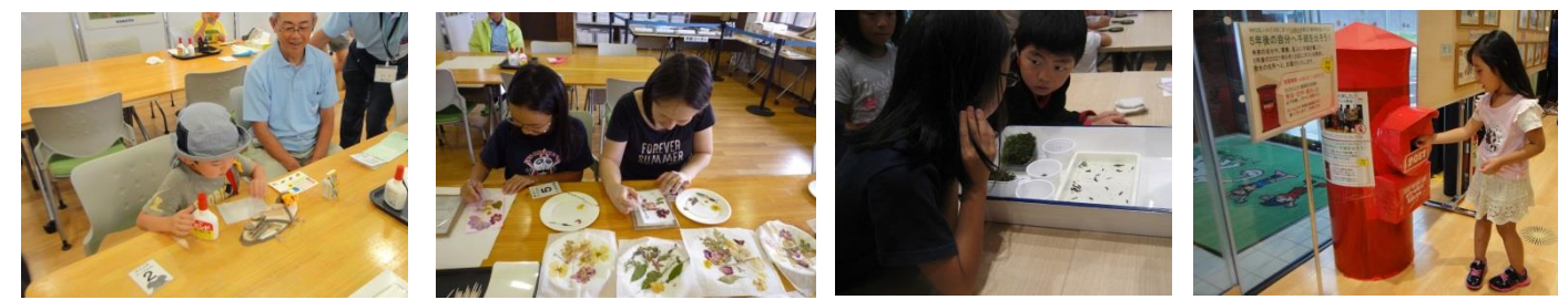
『カカシコンテスト』BEST3

今年で2回目となる『里山フェスティバル』を開催しました。 げんき里山にちなんだクイズを探しお散歩しながら楽しむ『げんき里山クイズラリー』や、間伐材を使用し、表札や置物を作る『木工工作』、こまつの杜で育てた花を使った『押し花アート』(里山グリーン部会花育チーム協賛)、普段あまり見ることのないホタルの幼虫を観察し小川に放流する『ホタルの幼虫観察・放流会』などたくさんのイベントでお客様をお迎えしました。 また、げんき里山には『カカシロード』が出現し、コマツ栗津工場OB会や他企業や保育園に募集をして集まった13組の団体のカカシを設置しました。カカシは全部で24体集まりました。どのカカシも個性豊かで里山が賑やかになりました。 さらに、来園されたお客様に1番良かったカカシを選んでもらう『カカシコンテスト』も開催しました。 5周年記念として、『5年後の自分へ手紙を出そう』では、未来の自分や家族、友人に宛てた手紙を書いてもらいました。5年後にみなさんの元へ郵送する予定です。 祝日ということもあり、多くのお客様の笑顔で賑わいました。