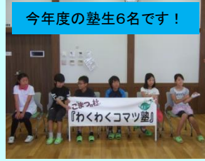
今年度の塾生6名です!

7月から活動する『わくわくコマツ塾』の開講式を開催しました。テーマは「砂鉄で学ぼう」、「地球にやさしい燃料電池」の2テーマで、小学5、6年生が各テーマ3名ずつ塾生として活動していきます。7月〜3月までの10か月間でそれぞれのテーマについて調査や実験を行っていき、最後は発表会を行います。初めての顔合わせということで、塾生は緊張した面持ちでしたが、これからの活動を楽しみにしてわくわくした表情も見られました。