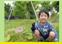
みんな里山で見てね