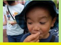
クワの実食べたよ!

ヨモギやシロツメクサなど食べられる植物を見つけながらこまつの杜を散策しました。 散策後、子どもたちは散策中に見つけたお気に入りの植物の名札を作りました。絵を描いたりして素敵な名札が完成しました! 参加した子供たちからは「食べられる植物が学べてよかった!」や「名札作りが楽しかった!」と感想が寄せられました。 里山に可愛い名札が立ってますのでぜひご覧ください。