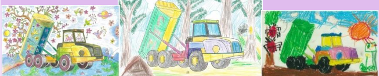
こまつの社大賞 大人部門

『夏休みぬりえコンクール』は今年で7回目を迎え、308点の応募がありました。今年のテーマはアーティキュレートダンプトラック『HM300』。たくさんのご応募ありがとうございました！受賞作品はHPIにて公開中です。